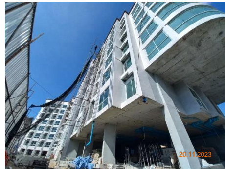
ภาพที่ 1.5-1 ความคืบหน้าของการก่อสร้างโครงการ