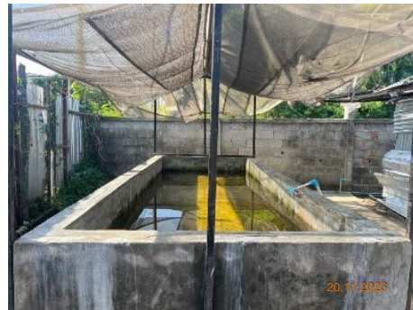
บริเวณบ้านพักคนงาน